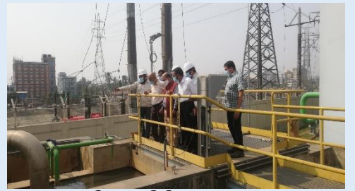
ব্যবস্থাপনা পরিচালক সিদ্ধিরগঞ্জ ৩৩৫মেঃওঃ সিসিপিপি এর DAF Modification কাজ পরিদর্শনের একাংশ