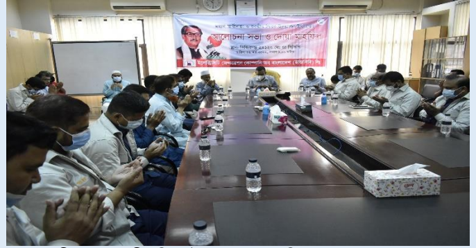
মহান স্বাধীনতা ও জাতীয় দিবস উপলক্ষে আয়োজিত আলোচনা সভা শেষে স্বাধীনতা যুদ্ধে আত্মত্যাগসর্গকারী শহীদদের আত্মার শান্তি কামনা করে দোয়া করা হয়

মুক্তিযুদ্ধের চেতনায় বাংলাদেশকে সমৃদ্ধির পথে নিয়ে যাওয়ার নতুন শপথ নিয়ে ২৬শে মার্চ ৫২তম স্বাধীনতা ও জাতীয় দিবস উদযাপিত হয়। ২৬ শে মার্চ মহান স্বাধীনতা ও জাতীয় দিবস উদযাপন উপলক্ষে ইজিসিবি'র সিদ্ধিরগঞ্জ ২৫১২০ মেও পিপিপি এ পতাকা উত্তোলন, আলোকসজ্জা এবং বিশেষ অনুষ্ঠান ও দোয়া মাহফিলের আয়োজন করা হয়। অনুষ্ঠানে উপস্থিত ছিলেন ইজিসিবির নির্বাহী পরিচালক ( ওএন্ডএম) ও প্রধান প্রকৌশলী (সিদ্ধিরগঞ্জ ২৫১২০ মেঃওঃ পিপিপি) মহোদয় এবং কর্পোরেট দপ্তর ও বিদ্যুৎ কেন্দ্রের অন্যান্য কর্মকর্তাগণ। অনুষ্ঠানে জাতীয় জীবনে ২৬শে মার্চের গুরুত্ব ও তাৎপর্য নিয়ে আলোকপাত করা হয়। পরিশেষে জাতির পিতা বঙ্গবন্ধু শেখ মুজিবুর রহমান, জাতীয় চার নেতা ও মুক্তিযুদ্ধে শহীদদের বিদেহী আত্মার শান্তি কামনা করে দোয়া করা হয়। এছাড়াও ২৬শে মার্চ প্রভাতে বিদ্যুৎ কেন্দ্রসমূহে জাতীয় পতাকা উত্তোলন করা হয় এবং বিদ্যুৎ কেন্দ্রসমূহে আলোকসজ্জার ব্যবস্থা করা হয়।