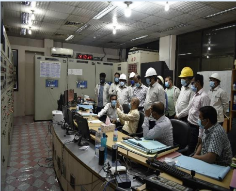
ব্যবস্থাপনা পরিচালক সিদ্ধিরগঞ্জ ২X১২০ মেঃওঃ পিপিপি এর কন্ট্রোলরুম পরিদর্শনকালে কর্মকর্তাবৃন্দের সাথে মতবিনিময় করেন। এ সময় ব্যবস্থাপনা পরিচালক মহোদয় বিদ্যুৎ কেন্দ্রের সার্বিক দিক নিয়ে আলোচনা করেন এবং প্রয়োজনীয় দিকনির্দেশনা প্রদান করেন।