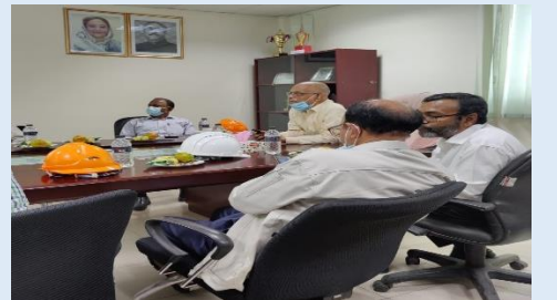
ব্যবস্থাপনা পরিচালক হরিপুর ৪১২মেঃওঃ সিসিপিপি এর কর্মকর্তাগণের সাথে আলোচনা সভা করেন এবং বিদ্যুৎকেন্দ্রের সার্বিক বিষয়ে আলোকপাত করেন।