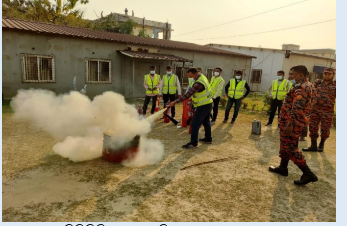
সিদ্ধিরগঞ্জ ২X১২০ মেঃওঃ পিপিপি এবং সিদ্ধিরগঞ্জ ৩৩৫ মেঃওঃ সিসিপিপি এর ফায়ার ড্রিলের একাংশ