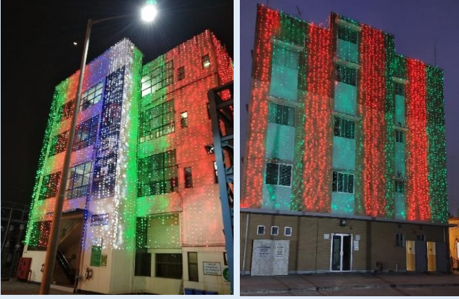
ঐতিহাসিক ৭ ই মার্চ, মুজিব শতবর্ষে শতভাগ বিদ্যুতায়ন ও জাতীয় দিবস উদযাপন উপলক্ষে ইজিসিবি এর বিদ্যুৎকেন্দ্র সমূহের প্রশাসনিক ভবন ও অন্যত্র আলোকসজ্জার ব্যবস্থা করা হয়।

বঙ্গবন্ধুর ৭ মার্চের ভাষণ বিশ্বের অন্যান্য শ্রেষ্ঠ ভাষণ থেকে উজ্জ্বল ও বিশেষ বৈশিষ্ট্যমণ্ডিত। এ ভাষণ নিরস্ত্র বাঙালি জাতিকে রাতারাতি সশস্ত্র করে তোলে। একটি ভাষণকে অবলম্বন করে স্বাধীনতার জন্য ৩০ লাখ বাঙালি জীবন উৎসর্গ ও কয়েক লাখ মা—বোন সন্ত্রম বিসর্জন দেন। '৭১—এর মুক্তিযুদ্ধকালে এ ভাষণ (বজ্রকণ্ঠ) রণাঙ্গনের মুক্তিযোদ্ধাদের শত্রুর বিরুদ্ধে লড়াইয়ে অনুপ্রাণিত করে। বলা যায়, এই একটি ভাষণ একটি জাতিরাত্রি, বাংলাদেশ সৃষ্টি করেছে, যা বিশ্বে নজিরবিহীন। জাতিসংঘ সংস্থা ইউনেসকো এ ভাষণকে ৩০ অক্টোবর ২০১৭ বিশ্ব—ঐতিহ্য সম্পদ হিসেবে স্বীকৃতি দিয়ে 'দ্য ইন্টারন্যাশনাল মেমোরি অব ওয়ার্ল্ড রেজিস্টার'—এ অন্তর্ভুক্ত করেছে।