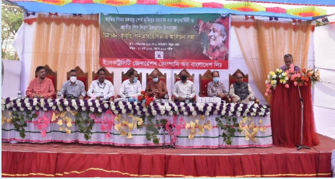
জাতির পিতা বঙ্গবন্ধু শেখ মুজিবুর রহমান ঐর জন্মবার্ষিকী ও জাতীয় শিশু দিবস উদযাপন উপলক্ষে আয়োজিত আলোচনা সভার একাংশ

জাতির পিতা বঙ্গবন্ধু শেখ মুজিবুর রহমান ঐর জন্মবার্ষিকী ও জাতীয় শিশু দিবস উদযাপন উপলক্ষে ১৭ই মার্চ, ২০২২ তারিখে ইজিসিবি'র সিদ্ধিরগঞ্জ ৩৩৫ মেঃওঃ সিসিপিপি প্রাঙ্গণে বিদ্যুৎ কেন্দ্রের কর্মকর্তা/কর্মচারীদের ছেলে-মেয়েদের অংশগ্রহণে দিনব্যাপি চিত্রাঙ্কন, আবৃত্তি ও গানের প্রতিযোগিতা এবং আলোচনা সভার আয়োজন করা হয়। উক্ত অনুষ্ঠানে ইজিসিবি লিঃ এর ব্যবস্থাপনা পরিচালক, নির্বাহী পরিচালক (পিএন্ডডি) ও নির্বাহী পরিচালক(ওএন্ডএম), ইজিসিবি'র বিদ্যুৎ কেন্দ্রসমূহের প্রধান প্রকৌশলী ও অন্যান্য কর্মকর্তাগণ উপস্থিত ছিলেন। অনুষ্ঠানে জাতির জনক বঙ্গবন্ধু শেখ মুজিবুর রহমানের জীবনীর উপর গুরুত্বপূর্ণ আলোচনা করা হয়। এ সময় জাতীয় জীবনের সার্বিক বিষয়ে জাতির পিতার আদর্শ অনুসরণ করার উপর আলোকপাত করা হয়। বঙ্গবন্ধু শেখ মুজিবুর রহমানের আদর্শকে ধারণ করে সৎ ও নিষ্ঠার সঙ্গে সকলে দায়িত্ব পালন করবেন বলে বক্তারা আশাবাদ ব্যক্ত করেন।