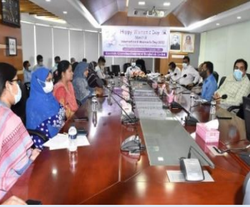
আন্তর্জাতিক নারী দিবস উপলক্ষ্যে ইজিসিবি লিঃ এর কর্পোরেট দপ্তরে ও বিদ্যুৎকেন্দ্র সমূহে আলোচনা সভার আয়োজন করা হয় এবং ইজিসিবিতে বিভিন্ন পদে কর্মরত নারী কর্মীদের ফুলের শুভেচ্ছা প্রদান করা হয়।