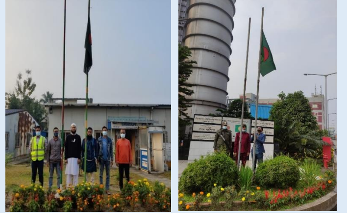
২১শে ফেব্রুয়ারি, আন্তর্জাতিক মাতৃভাষা ও শহীদ দিবস উদযাপন উপলক্ষে ইজিসিবি এর বিদ্যুৎকেন্দ্র সমূহে শহীদদের প্রতি শ্রদ্ধা জ্ঞাপন করা হয় এবং জাতীয় পতাকা অর্ধনমিত রাখা হয়।

বায়ান্নর ভাষা আন্দোলন পূর্ব বাংলা তথা বাংলাদেশীদের মধ্যে যে জাতীয় চেতনার উন্মেষ ঘটায়, তাই পরবর্তীকালে বাঙালি জাতীয়তাবাদের জন্ম দেয়। এই জাতীয়তাবাদী চেতনাই বাঙালি জাতিকে স্বশাসন অর্জনের দিকে পরিচালিত করে। এতে বাঙালির মনে যে বৈপ্লবিক চেতনা ও ঐক্যের উন্মেষ ঘটায়, তা পরবর্তীকালে সকল আন্দোলনে প্রাণশক্তি হিসেবে অনুপ্রেরণা যোগায়। সর্বোপরি একটি স্বাধীন সত্ত্বা হিসেবে আত্মপ্রকাশের পেছনে একুশের তাৎপর্য বাঙালি চিরদিন শ্রদ্ধাভরে স্মরণ রাখবে। একুশের চেতনাকে সারা বিশ্বে ছড়িয়ে দিতে প্রতিটি বাঙালিকে দায়িত্বশীল ভূমিকা পালন করতে হবে। বাংলা ভাষার সম্প্রসারণের মাধ্যমে বিশ্বপরিচয়ে বাঙালি হয়ে উঠবে অনন্য এক শক্তিশালী জাতি।