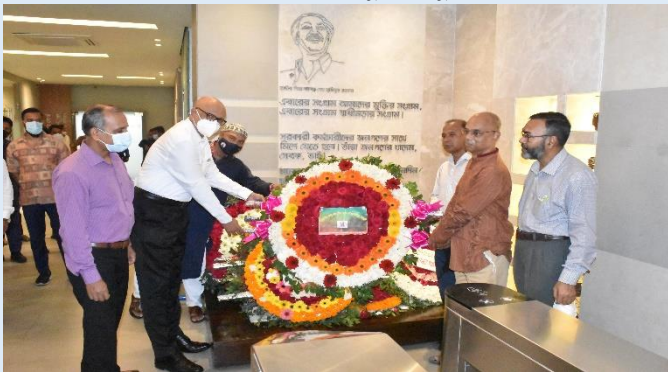
জাতির পিতা বঙ্গবন্ধু শেখ মুজিবুর রহমান ঐর জন্মবার্ষিকী উপলক্ষে ইজিসিবি লিঃ এর পক্ষ হতে বিদ্যুৎ ভবন ও সিদ্ধিরগঞ্জ ৩৩৫মেঃওঃ সিসিপিপি তে অবস্থিত বঙ্গবন্ধু কর্ণারে পুষ্পস্তবক অর্পণ করা হয়।

জাতির পিতা বঙ্গবন্ধু শেখ মুজিবুর রহমান ঐর জন্মবার্ষিকী ও জাতীয় শিশু দিবস উদযাপন উপলক্ষে ইজিসিবি'র সিদ্ধিরগঞ্জ ৩৩৫ মেঃওঃ সিসিপিপি প্রাঙ্গণে বিদ্যুৎ কেন্দ্রের কর্মকর্তা/কর্মচারীদের ছেলে-মেয়েদের অংশগ্রহণে দিনব্যাপি চিত্রাঙ্কন, আবৃত্তি ও গানের প্রতিযোগিতা শেষে ব্যবস্থাপনা পরিচালক মহোদয় প্রতিযোগিতায় বিজয়ীদের হাতে পুরস্কার তুলে দেন।