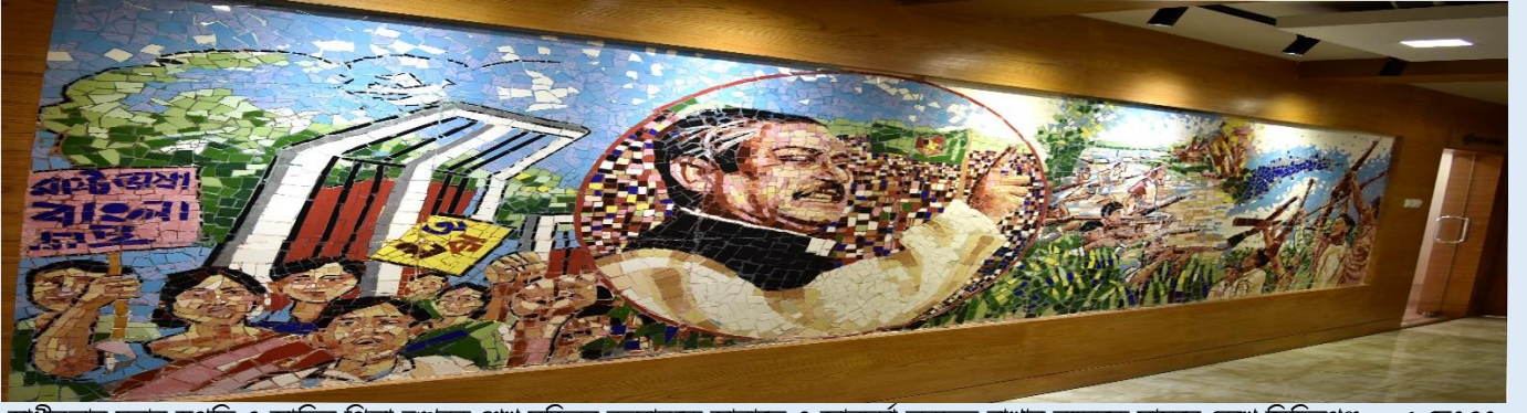
স্বাধীনতার মহান স্থপতি ও জাতির পিতা বঙ্গবন্ধু শেখ মুজিবুর রহমানকে জানাতে ও জ্ঞানচর্চা অব্যাহত রাখার লক্ষ্যকে সামনে রেখে সিদ্ধিরগঞ্জ ৩৩৫ মেঃওঃ সিসিপিপি তে মুজিব কর্ণার উদ্বোধন করা হয়।