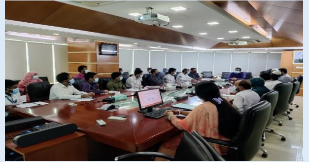
ইজিসিবি'র কর্মকর্তা ও কর্মচারীদের বিভিন্ন প্রশিক্ষণের স্থিরচিত্র