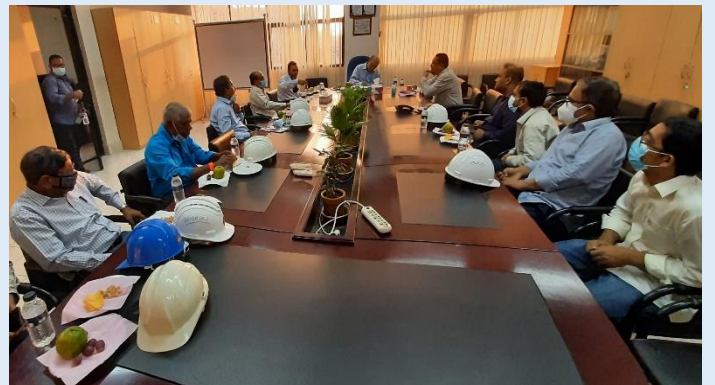
ব্যবস্থাপনা পরিচালক এবং নির্বাহী পরিচালক (ওএন্ডএম) মহোদয়ের সাথে সিদ্ধিরগঞ্জ ২X১২০ মেঃওঃ পিপিপি বিদ্যুৎ কেন্দ্রের কর্মকর্তাবৃন্দের আলোচনা সভার একাংশ। এ সময় ব্যবস্থাপনা পরিচালক মহোদয় বিদ্যুৎ কেন্দ্রের সার্বিক দিক নিয়ে আলোচনা করেন এবং প্রয়োজনীয় দিকনির্দেশনা প্রদান করেন।