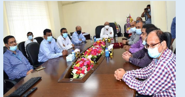
ইজিসিবি'র চেয়ারম্যান মহোদয়ের সভাপতিত্বে অনুষ্ঠিত আলোচনা সভার স্থিরচিত্র। এ সময় চেয়ারম্যান মহোদয় বিদ্যুৎ কেন্দ্রের সার্বিক দিক নিয়ে আলোচনা করেন এবং প্রয়োজনীয় দিকনির্দেশনা প্রদান করেন।