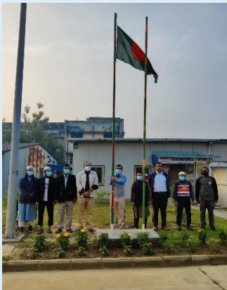
স্বাধীনতার সুবর্ণ জয়ন্তীতে ইজিসিবি'র বিদ্যুৎ কেন্দ্রসমূহে জাতীয় পতাকা উত্তোলন এবং শহীদদের প্রতি শ্রদ্ধা জ্ঞাপন