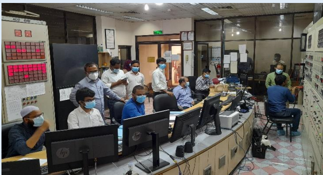
সিদ্ধিরগঞ্জ ২X১২০ মেঃওঃ পিপিপি এর এন্যুয়েল ডিপেন্ডেবল ক্যাপাসিটি টেস্ট সম্পন্ন

ইজিসিবি'র নারায়ণগঞ্জের সিদ্ধিরগঞ্জে অবস্থিত ২X১২০ মেঃওঃ পিপিপি এর উভয় গ্যাস টার্বাইনের এন্যুয়েল ডিপেন্ডেবল ক্যাপাসিটি টেস্ট গত ২১ অক্টোবর ২০২১ তারিখে সম্পন্ন হয়। এ সময় বিউবো, পিজিসিবি এবং বিদ্যুৎ কেন্দ্রের কর্মকর্তাবৃন্দ উপস্থিত ছিলেন। বিদ্যুৎ কেন্দ্রের ডিপেন্ডেবল ক্যাপাসিটি ২০৮.৬১৫ মেঃওঃ পাওয়া গিয়েছে।