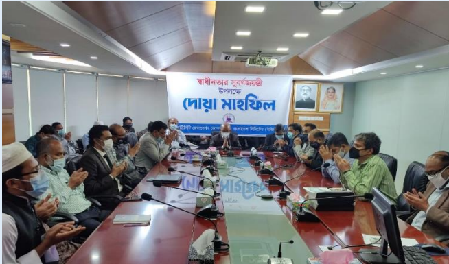
বিজয় দিবসে স্বাধীনতার সূর্যসন্তানদের জন্য ইজিসিবিতে দোয়ার আয়োজন