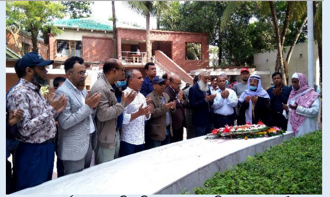
পুষ্পস্তবক অর্পণ শেষে জাতির পিতার আত্মার শান্তি কামনা করে তাঁর জন্য দোয়া করা হয়

মুজিব বর্ষ উৎযাপনের অংশ হিসেবে ইজিসিবি লিঃ কর্তৃক গোপালগঞ্জের টুঞ্জিপাড়ায় অবস্থিত জাতির জনক বঙ্গবন্ধু শেখ মুজিবুর রহমান এর সমাধিসৌধে শ্রদ্ধা জানাতে ২১ নভেম্বর, ২০২১ তারিখে ভ্রমণ করা হয়। উক্ত ভ্রমণে ইজিসিবি'র ব্যবস্থাপনা পরিচালক, নির্বাহী পরিচালকগণ ও অন্যান্য কর্মকর্তাগণ অংশগ্রহণ করেন। এ সময় গোপালগঞ্জ ১০০ মেঃওঃ পিকিং পাওয়ার প্লান্ট এর কর্মকর্তাগণ উপস্থিত থেকে উক্ত ভ্রমণে সার্বিক সহযোগিতা প্রদান করেন। ইজিসিবি'র কর্মকর্তাগণ জাতির পিতার সমাধি সৌধ কমপ্লেক্স এর অন্তর্ভুক্ত বিভিন্ন ঐতিহাসিক গুরুত্বপূর্ণ সংগ্রহ বিশিষ্ট জাদুঘর, দুর্লভ ছবিসম্পন্ন ফটোগ্যালারি এবং বঙ্গবন্ধুর জীবনী ও বাংলাদেশের ইতিহাস সম্পর্কিত বইসমৃদ্ধ লাইব্রেরী পরিদর্শন করেন। ইজিসিবি'র কর্মকর্তাগণ জাতির পিতার সমাধিসৌধে পুষ্পস্তবক অর্পণ করেন এবং সকলে একত্রিত হয়ে মহান আল্লাহ্ তায়ালার দরবারে জাতির পিতার আত্মার শান্তি কামনা করে দোয়া করেন।