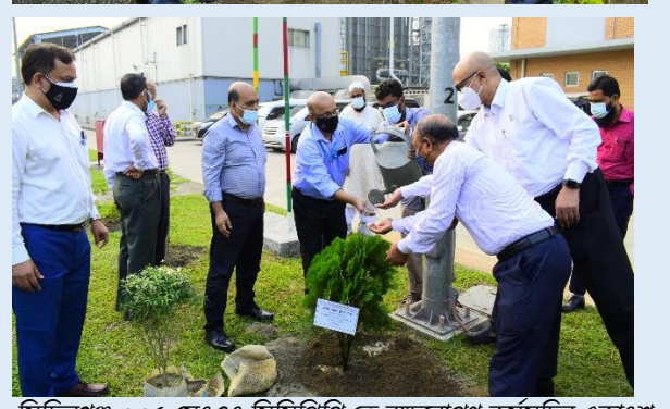
সিদ্ধিরগঞ্জ ৩৩৫ মেঃওঃ সিসিপিপি তে বৃক্ষরোপণ কর্মসূচির একাংশ