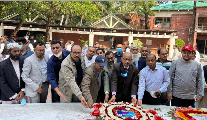
জাতির জনক বঙ্গবন্ধু শেখ মুজিবুর রহমান এর সমাধিসৌধে পুষ্পস্তবক অর্পণ