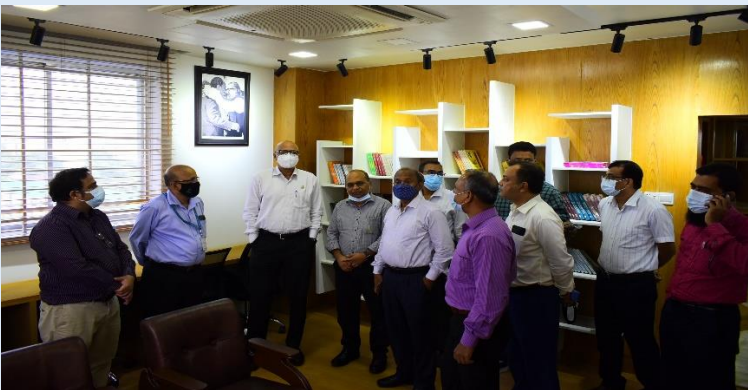
সিদ্ধিরগঞ্জ ৩৩৫ মেঃওঃ সিসিপিপি তে মুজিব কর্ণার উদ্বোধন এবং জাতীয় জীবনে শেখ মুজিবের আদর্শ ধারণের বিষয়ে সংক্ষিপ্ত আলোচনা করা হয়।