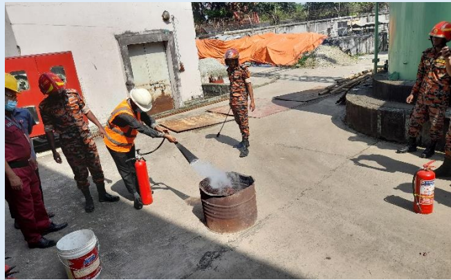
সিদ্ধিরগঞ্জ ২X১২০ মেঃওঃ পিপিপি বিদ্যুৎ কেন্দ্রের ফায়ার ড্রিলের একাংশ

ইজিসিবি'র সিদ্ধিরগঞ্জে ২X১২০ মেঃওঃ পিপিপি এর গ্যাস টার্বাইন-২ এর মেজর ইন্সপেকশন কাজ ০৭ নভেম্বর, ২০২১ হতে এবং দ্বিতীয় ইউনিটের জেনারেটর ওভারহোলিং ১২ নভেম্বর, ২০২১ হতে শুরু হয়। ইজিসিবি'র ব্যবস্থাপনা পরিচালক, নির্বাহী পরিচালক (ওএন্ডএম) মহোদয় গত ১৮ নভেম্বর, ২০২১ তারিখে বিদ্যুৎ কেন্দ্রের গ্যাস টার্বাইন-২ এর মেজর ইন্সপেকশন এবং দ্বিতীয় ইউনিটের জেনারেটর ওভারহোলিং পরিদর্শন করেন। পরিদর্শন শেষে বিদ্যুৎ কেন্দ্রের কর্মকর্তাবৃন্দের সাথে বিদ্যুৎ কেন্দ্রের সার্বিক বিষয়ে আলোচনা সভায় অংশ নেন।