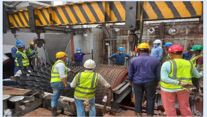
সিদ্ধিরগঞ্জ ২X১২০ মেঃওঃ পিপিপি বিদ্যুৎ কেন্দ্রের গ্যাস টার্বাইন-২ এর মেজর ইন্সপেকশন কাজের একাংশ

ইজিসিবি'র নারায়ণগঞ্জের সিদ্ধিরগঞ্জে অবস্থিত ২X১২০ মেঃওঃ পিপিপি এর উভয় গ্যাস টার্বাইনের এন্যুয়েল ডিপেন্ডেবল ক্যাপাসিটি টেস্ট গত ২১ অক্টোবর ২০২১ তারিখে সম্পন্ন হয়। এ সময় বিউবো, পিজিসিবি এবং বিদ্যুৎ কেন্দ্রের কর্মকর্তাবৃন্দ উপস্থিত ছিলেন। বিদ্যুৎ কেন্দ্রের ডিপেন্ডেবল ক্যাপাসিটি ২০৮.৬১৫ মেঃওঃ পাওয়া গিয়েছে।